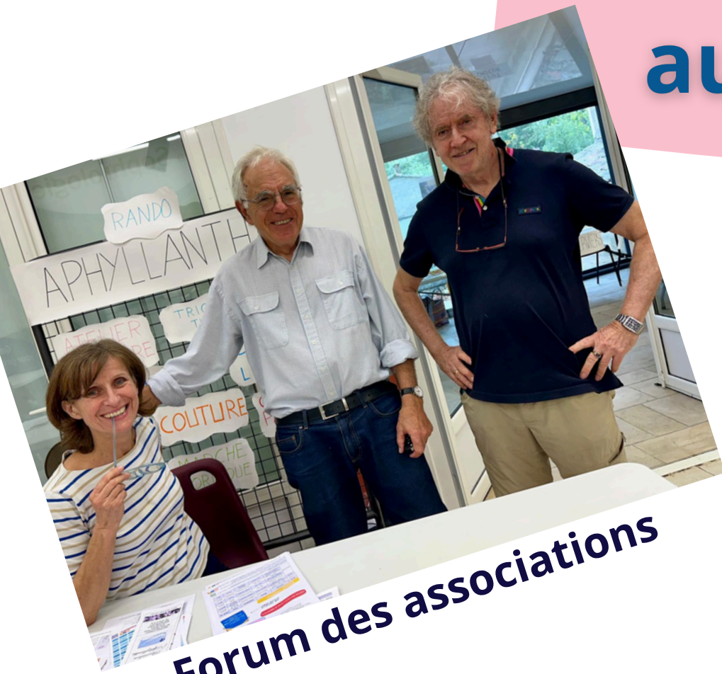
Forum des associations