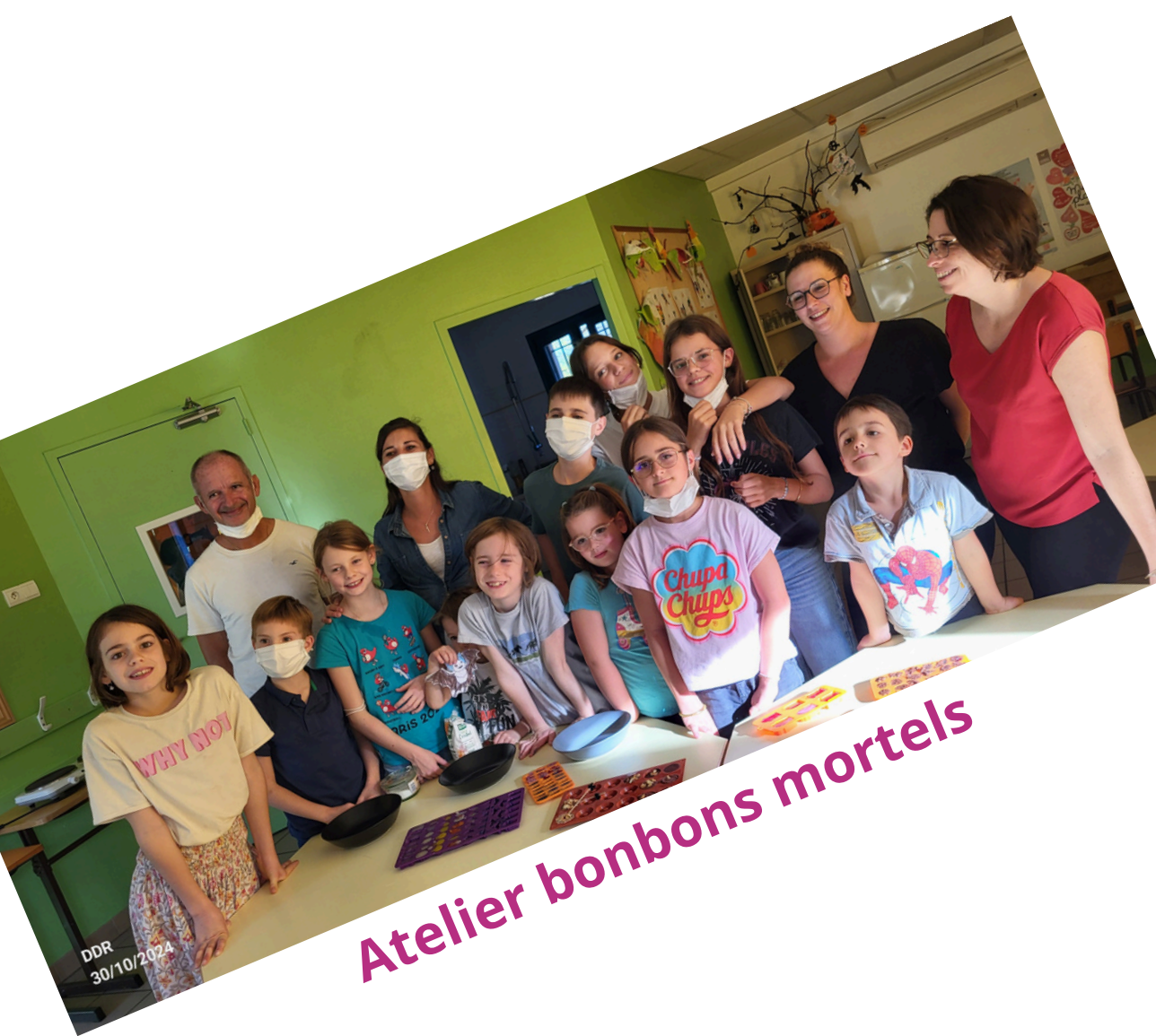
Atelier bonbons mortels