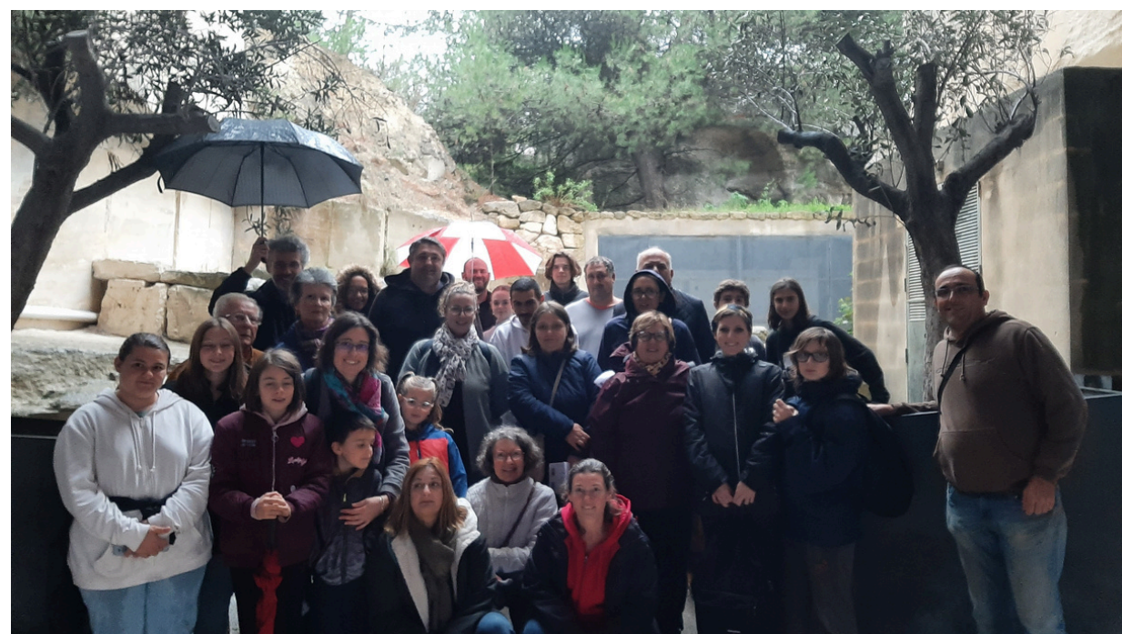
Carrières des Lumières