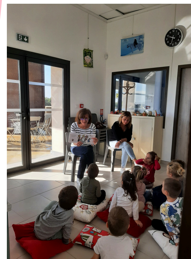
Heure du conte